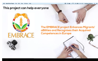
Embrace project idee en doelen

Klik op de plaatjes om de promotie filmpjes te bekijken: