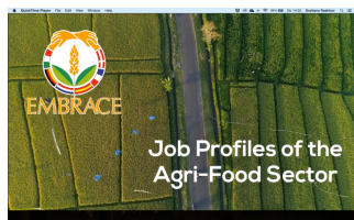
Professionele profielen in de Agri-Food Sector