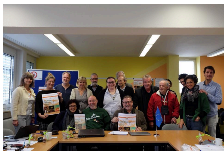
Tübingen, Germany, 22th March 2018

Met dit motto hielden de partners van Embrace afgelopen maart een Internationale bijeenkomst in Tübingen, Duitsland. Hiervoor werden leerlingen, loopbaanadviseurs, opvoeders, deskundigen, stagiairs, trainers, vluchtelingen en vrijwilligers uitgenodigd om te discussiëren en ideeën uit te wisselen over arbeidsmarktintegratie van migranten en de eerste projectresultaten te presenteren: Een samenvattende catalogus van de behoeftes en professionele profielen in de agri-food sector.